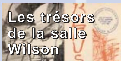
Les trésors de la salle Wilson