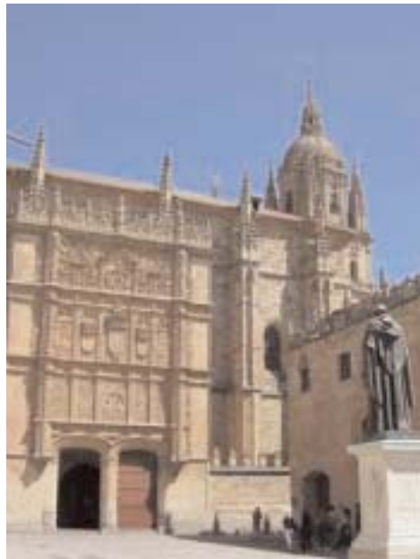
Université de Salamanca