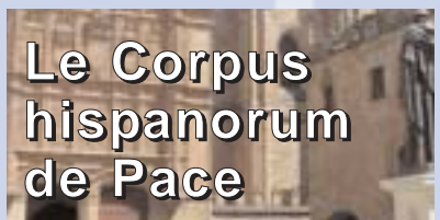
Le Corpus hispanorum de Pace