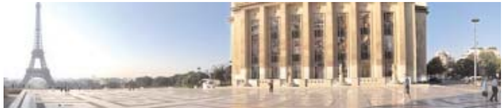
La place du Trocadéro, in Paris, where the Universal Declaration of Human Rights was proclaimed in 1948

Following the launch of its new programs in ethic, the College has undertaken a new venture that will ultimately lead to the creation of a Human Rights Center at the Dominican College. This center will provide a place for research, events and the development of programs on human rights.