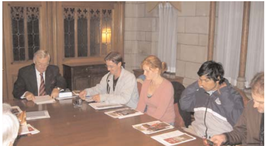
Le Président du Sénat, Noël Kinsella, reçoit des étudiants du Collège au Sénat pour un cours sur la Charte des droits et libertés du Canada

Soucieux d'être plus présent dans la communauté des affaires de la région d'Ottawa, nous présentons cette année cinq conférences déjeuners sur l'éthique des affaires. Après une